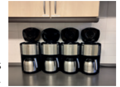
Danke an Senioren

Am 27. Oktober 2024 werden wir im Gottesdienst um 10 Uhr die Goldene Konfirmation der Jahrgänge 1973 und 1974 (Geburtsjahrgänge 1958 bis 1961) feiern. Leider haben wir kaum noch Adressen von denjenigen, die wir dazu einladen möchten. Wer uns helfen kann mit Hinweisen zu Wohnorten damaliger Mitkonfirmand*innen, möge sich bitte im Gemeindebüro melden (Tel. 0511 5905977).