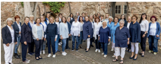
Frauenchor Vocal Temptation

Wasser-Luft. Lassen Sie sich von der Vielfältigkeit des Repertoires in diesem Konzert überraschen.